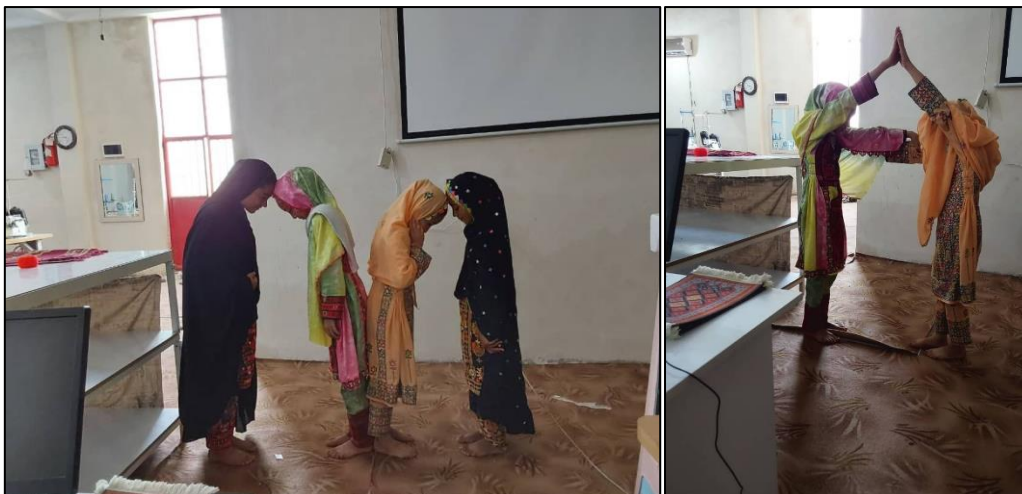
تصاویر شماره دو: بازی کودکان در جلسه اول کلاس آموزش زبان انگلیسی در مرکز فنوج