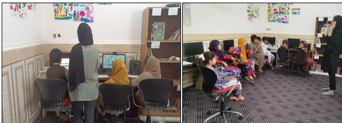
تصاویر شماره سه: کلاس‌های آموزش کامپیوتر در مرکز آموزش از راه دور دایمی آباد

از آنجایی که مرکز آموزش از راه دور دایمی آباد برای برگزاری کلاس‌های آنلاین دارای مشکلاتی بود، طی چند نوبت مراجعه به مرکز و بررسی سیستم‌ها، لوازم مورد نیاز خریداری شد و تعمیرات لازم نیز انجام شد. هم‌اکنون کلاس قصه و آواز کودکان به صورت آنلاین و چند کلاس کامپیوتر به صورت حضوری در چند سطح و با چند مربی برای بیش از ۲۰ نفر از کودکان ۷ تا ۱۲ سال در حال برگزاری است. اشتیاق کودکان به حضور و استعدادشان در یادگیری، هر جلسه ما را ذوق‌زده می‌کند.