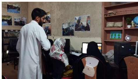
تصاویر شماره پنج: کلاس‌های کامپیوتر، نقاشی و موسیقی با حضور داوطلبان اردیبهشت