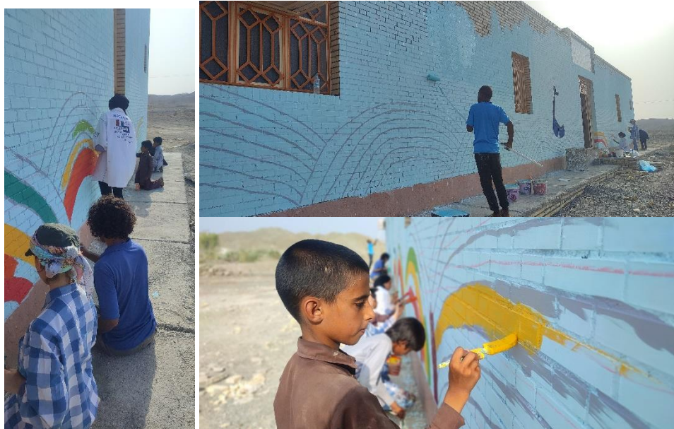
تصاویر شماره دو: همراهی داوطلبان اردیبهشت و کودکان توتان، در نقاشی دیواری دبیرستان دختران اردیبهشت

قلبی روشن هم برای شما که راه، دشوار است و همسفران یک‌دل و دل‌دار می‌خواهد.