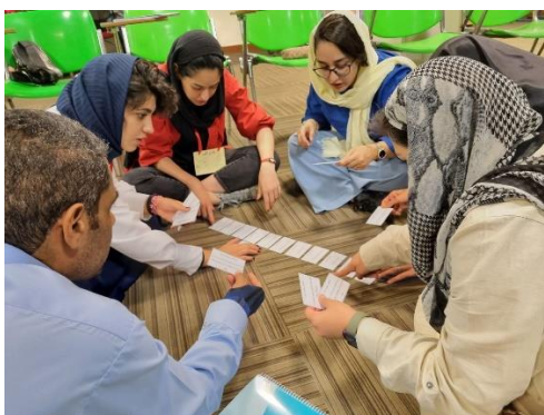
تصویر شماره چهار: حضور داوطلبان اردیبهشت در دوره آموزشی معلمان، موسسه آمال

ما در موسسه توسعه پایدار اردیبهشت معتقدیم که امر نیک، کاری تخصصی است و افرادی که وارد این حوزه می‌شوند لازم است، مدام در زمینه‌های مرتبط با تسهیلگری و شناخت و برقراری ارتباط موثر با جامعه مخاطب آموزش ببینند. از این رو داوطلبان اردیبهشت نیز با توجه به تمرکز موسسه در زمینه آموزش، در تابستان امسال در دوره‌ی آموزش معلمان که با همکاری موسسه آمال و توسعه خیریه و ابتکار نوید برگزار شد، شرکت کردند. همچنین داوطلبان این موسسه به علت در دسترس نبودن آموزش‌های حضوری، از آموزش در بستر فضای مجازی نیز بهره می‌برند.