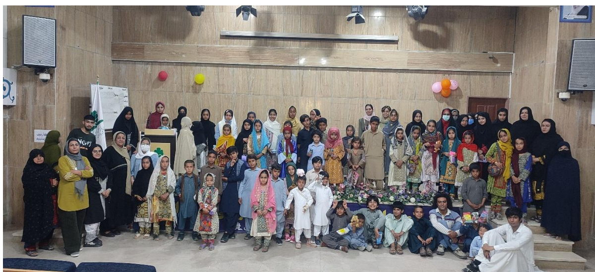
تصاویر شماره هفت: رویداد پایان تابستان گروه نگین