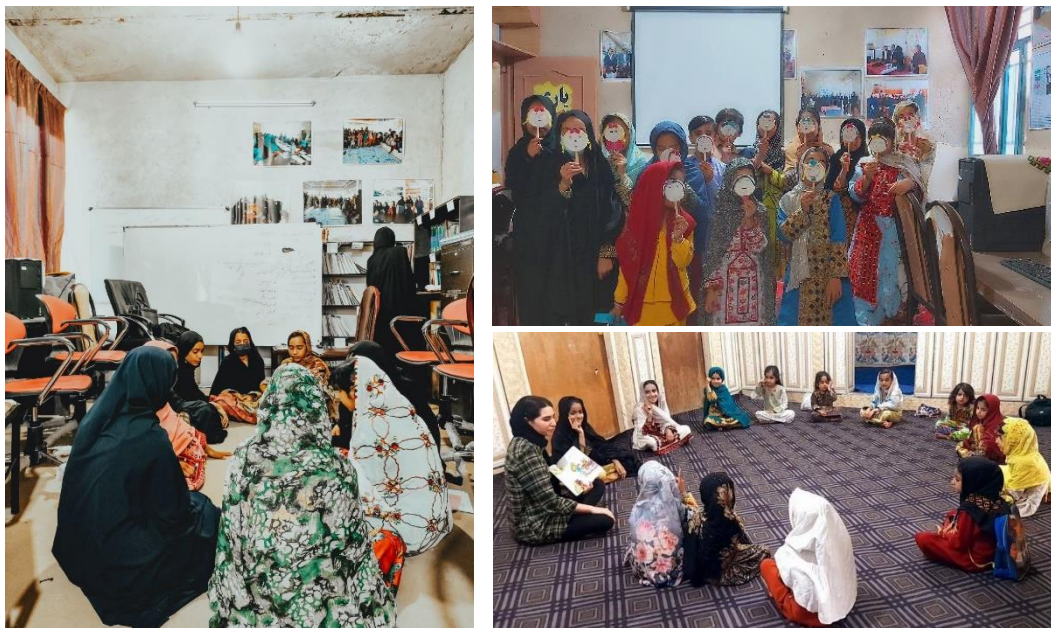
تصویر شماره شش: کلاس کاردستی و کتابخوانی و کسب و کار در پروژه نگین با همراهی داوطلبان اردیبهشت دو رویداد نیز برای پایان تابستان و زمستان برنامه‌ریزی شده بود که در پایان شهریورماه امسال این رویدادها با همکاری داوطلبان موسسه، اعضای گروه نگین و خانم‌های خانه هدی برگزار شد.