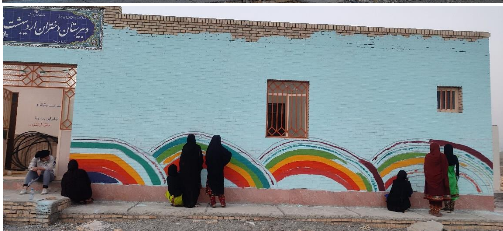
تصاویر شماره سه: نقاشی دیواری دبیرستان اردیبهشت توتان با همراهی دختران به اتمام رسید