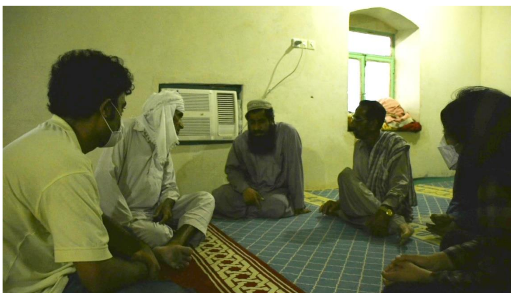
تصویر شماره سه: جلسه با معتمدان در مسجد روستای خاکران

روز اول ورود به توتان به بازدید از سه روستای خاکران، نوک‌آباد و پیربونی گذشت. در این بازدیدها، نشست‌هایی در منازل و مساجد با روحانیون و مردم و معتمدین برگزار شد. عمده گفتگوها در این نشست‌ها پیرامون موضوع زمین‌اهدایی و لزوم ساخت دبیرستان می‌گشت.