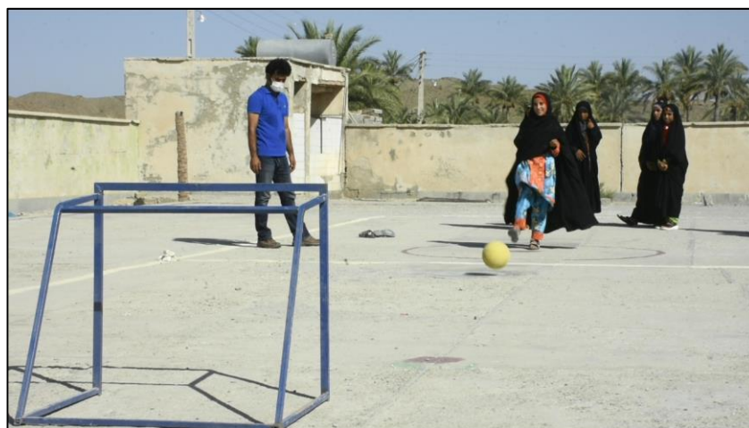
تصاویر شماره پنج: حضور دختران در مسابقه پناستی

در مسابقات طناب‌کشی هم دختران و پسران با انرژی و سماجت تمام شرکت کردند. بردند و باختند. پذیرفتند و به هم تبریک گفتند و ما دیده‌بودیم که جایزه دست زیور در واقع جایزه برای همه بچه‌های خاکران است، از بس همراه و همدل و هم‌بازی‌اند.