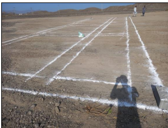
تصاویر شماره نه: نقشه ریزی و خرید مصالح دبیرستان

با انتشار خبر کلنگ زنی دبیرستان، افراد زیادی با حمایت های مالی و مشورتی خود به کمپین «زنگ اول: مدرسه» پیوستند. ما همه با هم هنوز در ابتدای راهی هستیم که می تواند منجر به تربیت زنان دانشمند و جامعه ای قدرتمند و صلح طلب شود.