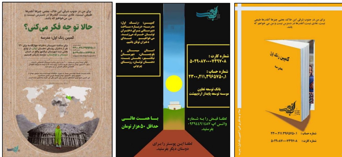
تصویر شماره دو: نمونه پوسترهای کمپین

در ادامه، قرار شد تعداد زیادی پوستر، ویدئو کلیپ، عکس نوشت، اینفوگرافی، مقاله، یادداشت و خلاصه محصولات نوشتاری و تصویری برای انتشار در شبکه‌های اجتماعی و روزنامه‌ها آماده شود. اولین چراغ را دوستانی از خارج استان روشن کردند با اجرای پوستری که ضمن معرفی توتان، زنگ آغاز راه را به صدا درآورده بود. بعد از آن چهار پوستر، یک اینفوگرافی، یک ویدئو کلیپ، یک عکس نوشت، چهار مطلب کوتاه و بلند تهیه و به تدریج منتشر شد. البته برخی مطالب نیز در شلوغی روزهای آخر خرداد بیات شد و از انتشار جا ماند. پس از انتشار مطالب در صفحه اینستاگرام و تلگرام موسسه، هم‌رسانی زیادی انجام شد و افراد و گروه‌های زیادی همراهی کردند. دوستان فراوانی از راه دور و نزدیک با این کمپین همراه شدند و صدای دختران توتان را به زبان‌هایی که می‌توانستند ترجمه کردند.