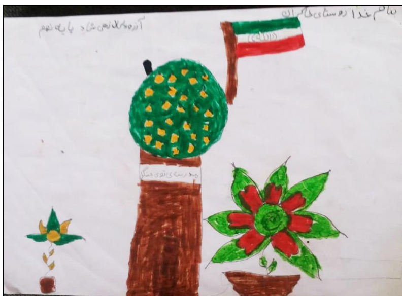
تصویر شماره هفت: نقاشی دانش‌آموزان توتان با موضوع «مدرسه مورد علاقه من»