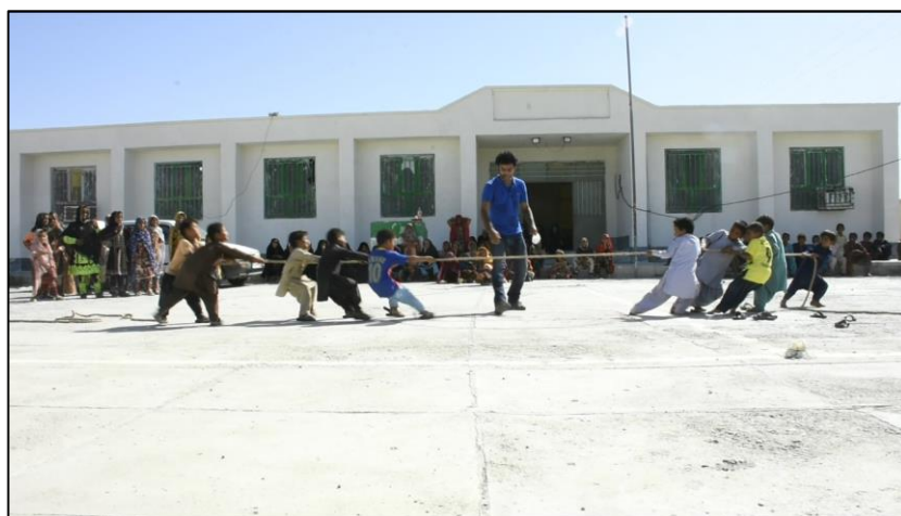
تصاویر شماره شش: برگزاری مسابقه طناب‌کشی دانش‌آموزان توتان

با گرم‌تر شدن هوا مسابقات ورزشی به اتمام رسید و قرار شد دختران دبیرستان درباره مدرسه مورد علاقه خودشان بنویسند و نقاشی کنند. چندتا از دبستانی‌ها هم قاچاقی به جمع نقاشان و نویسندگان پیوستند و چقدر هم حضورشان جالب بود. از اقلیم‌های مختلف جهان حرف زدیم، از مدرسه‌های برفی و درختی و کپری و دریایی. اما در نهایت در نوشته‌های بچه‌ها توقع زیادی از مدرسه وجود نداشت. اغلب دوست داشتند فقط مدرسه‌ای در روستای خودشان داشته‌باشند که معلم‌هایش خانم باشند تا به خاطر وجود معلم آقا، دختران مجبور به ترک تحصیل نشوند، آرزو داشتند مدرسه‌شان آب و برق و کولر و میز و صندلی داشته‌باشد تا وسط امتحان از شدت گرما هی بلند نشوند و برای نفس کشیدن به جاهای دیگر نروند. آرزو داشتند مدرسه‌شان سرویس بهداشتی داشته‌باشد، سرویس بهداشتی که آب دارد. کاش می‌شد تمام نوشته‌های بچه‌ها و حرف‌هایشان موقع نوشتن را به این گزارش سنجاق کرد!