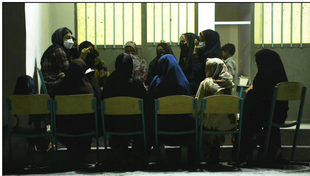
تصویر شماره چهار: گفتگو با دختران توتان درباره دبیرستان